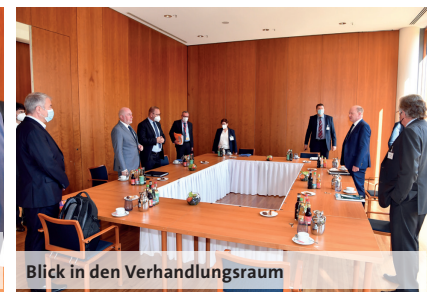
Blick in den Verhandlungsraum